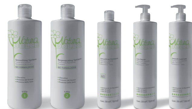
Flac. 500 ml