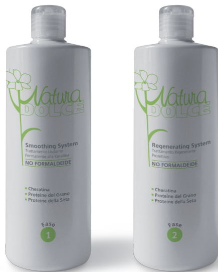
Flac. 500 ml

Natura Dolce ha messo a punto un sistema lisciante permanente dalla Formula innovativa con alta concentrazione di Keratina priva di agenti aggressivi che consente di trattare capelli ricci o crespi portandoli ad uno stato di LISCIO ASSOLUTO.